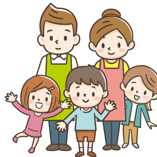
児童養護施設の先生