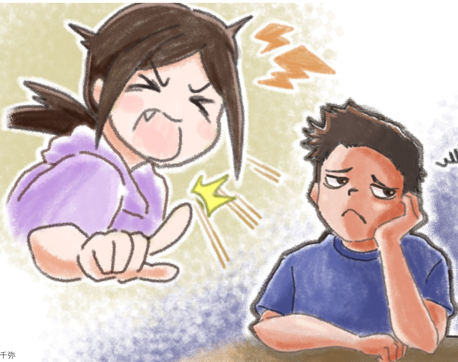
イラスト：市橋千弥