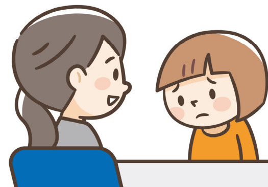
スクールカウンセラー