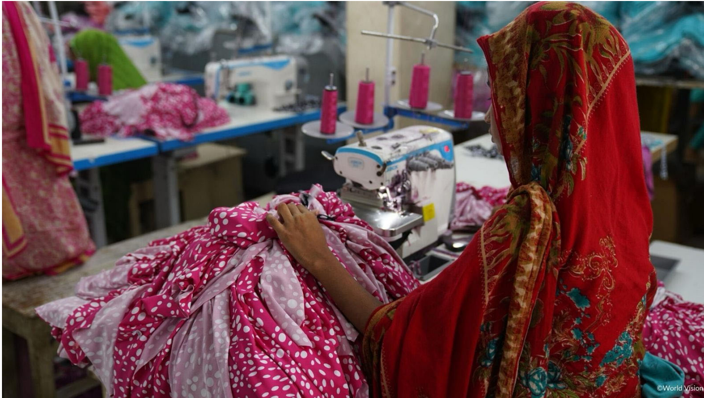
縫製工場で働く少女