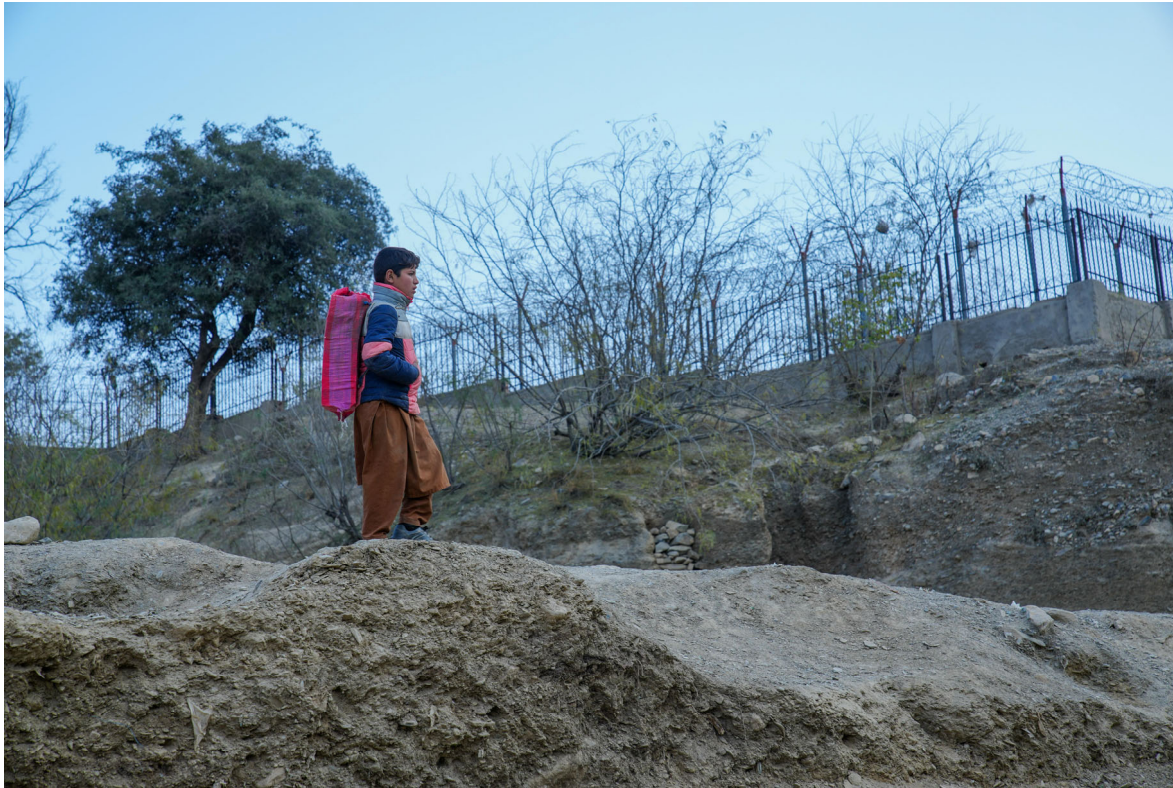
歩いてトールハムの国境を越える少年